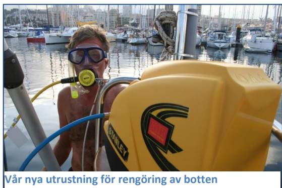
Vår nya utrustning för rengöring av botten

En av årets sista dagar köpte vi en dykkompressor. Det är en Stanley Air Power Centre kompressor (oljefri) med en 1.5 kW (2HP) motor som går på 220 volt. Kompressorn har en 6-liters tank med 0 till 8 bar tryck vid drift och den väger 8.5 kg. Vi köpte också en 15 meter lufttryckslang av god kvalitet (tål 20 bar) och en regulator. Kostnad (inklusive pressade kopplingar till slangen och regulatort) ca 3.000 kronor. Utrustningen skall användas för att göra ren botten på båten.