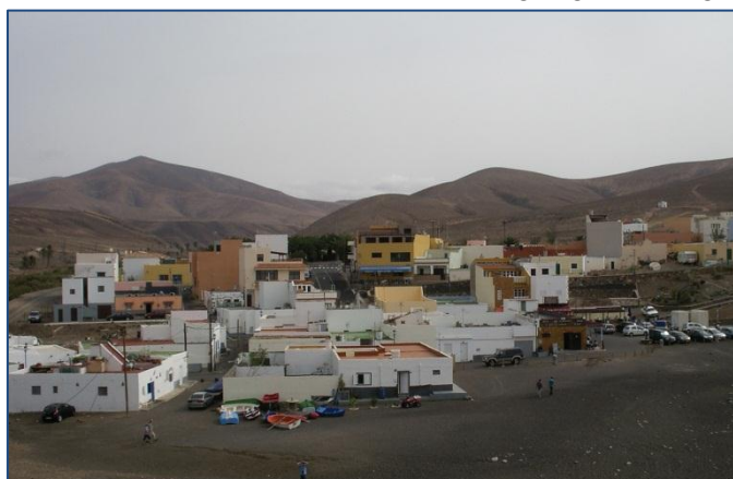
En av de små byarna på Fuerteventura

och vatten vid bryggan. Här kunde vi grilla vårt kött, vi hittade en mysig grillplats under tak så det gjorde inget att det regnade lite. Vi hyrde bil och såg oss omkring. Då Gran Tarajal ligger ungefär mitt på ön kunde vi dela upp turen i tre dagar, en dag den norra delen, en dag den södra och sista dagen centrala delen av ön. Fuerteventura erbjuder inte så mycket för turister mer än de fantastiska stränderna i söder. Där är också nästan alla turister så resten av ön är rätt opåverkad av turism. Här finns många getter, enligt böckerna lär det vara fler getter än människor på ön!