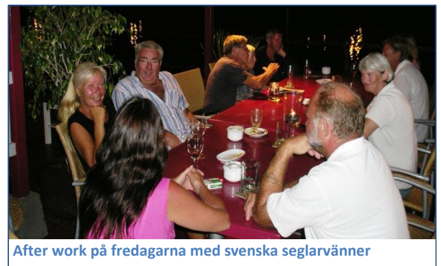
After work på fredagarna med svenska seglarvänner

prat och skratt på svenska! Vi köpte en robust kamera, Olympus Tough 810, som kan användas under vattnet ner till 10 meters djup och testade den vid Papagayo-stranden. Första dagen fick vi många fisk-stjärter på bilderna, men vi lärde oss efter hand att få bättre bilder. Mot slutet av månaden åkte vi till Göteborg för att besöka familj och vänner.