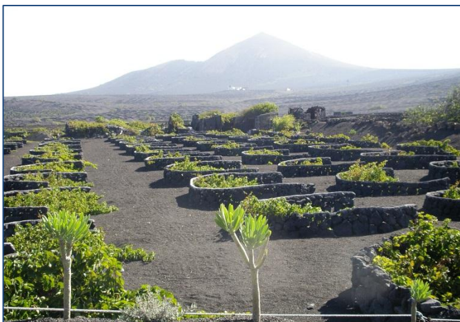
Vinodling på Lanzarote