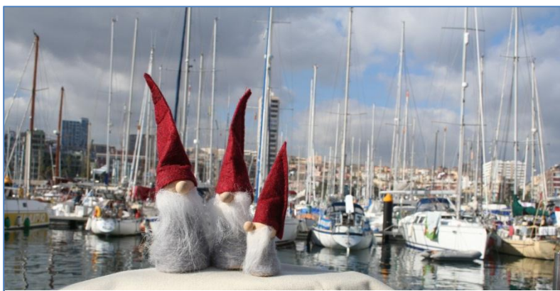
Tomten hittade till Las Palmas också!