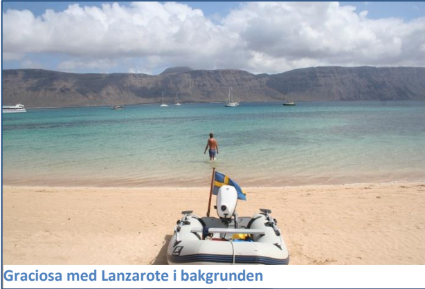
Graciosa med Lanzarote i bakgrunden

Vi lämnade Madeira mitt på dagen den 11 september för att segla mot Kanarieöarna. Vi fick bra vind redan när vi kom ut från hamnen, vi gjorde 7,5 knop! Vi passerade nära öarna Ilha Deserta som såg både övergivna och ogästvänliga ut och vid 15.30 hade även dessa öar försvunnit i aktern. Vindrodet styrde, vi hade revad stor, kutterflock och genua och seglade i god vind från sidan. Fullmånen gjorde natten klar som på dagen! En dag och en natt senare skymtade vi Lanzarote tidigt på morgonen den 13 september och vid