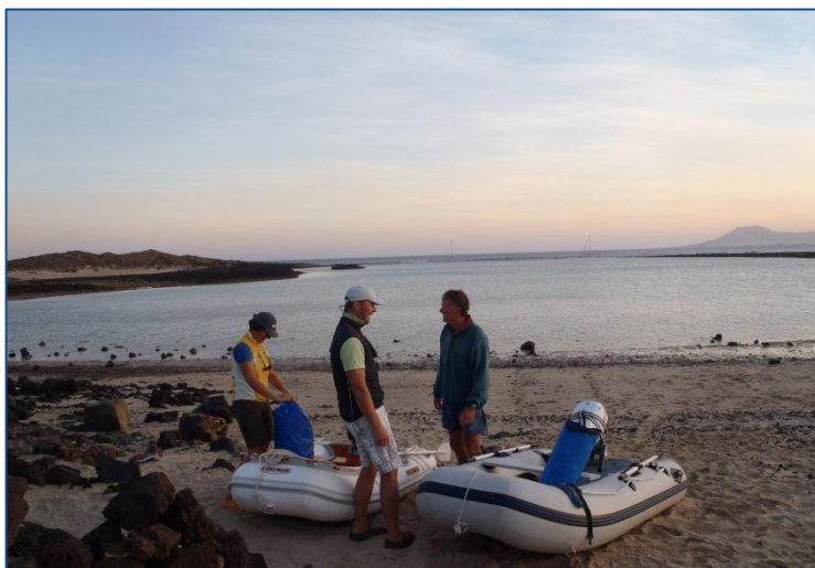
Vi väntar på att vattnet skall stiga så vi kan ta oss ut till båtarna

Vädret var nu lite ostadigare så medan vi väntade på bättre väder för fortsatt segling söder ut, hyrde vi bil och såg mer av ön. Den 6 december såg väderprognosen bättre ut och vi kom iväg, lite ”ringrostiga” efter flera månader i hamn. Första natten ankrade vi och Ooros vid Isla Lobos , en liten ö norr om Fuerteventura (knappt 10 nm från Lanzarote). Vi tog dingarna in till land och såg oss omkring på den lilla ön som är naturskyddad. Vi vandrade på de fina stigarna och klättrade upp på en utsiktspunkt med fin vy över både Fuerteventura och Lanzarote. När vi hade sett nog skulle vi hämta det goda köttet vi hade köpt för att grilla och äta på stranden, men av det blev inget. Vi hade lagt dingarna inne i en f.d. krater och under tiden vi varit på ön hade vattnet sjunkit och dingarna kom inte över revet! Vi fick vänta länge innan vattnet steg igen och i det sista dagsljuset drog vi dingarna över revet! Det blev inget gott kött utan ugnsstekt falukorv till middag. Efter en ”rullig” natt fortsatte vi nästa dag de 40 sjömil till Gran Tarajal på Fuerteventura . Gran Tarajal är en skyddad hamn med en kommunal marina. Det innebär låg avgift och låg service! Fanns t ex inga duschar eller toaletter, men el