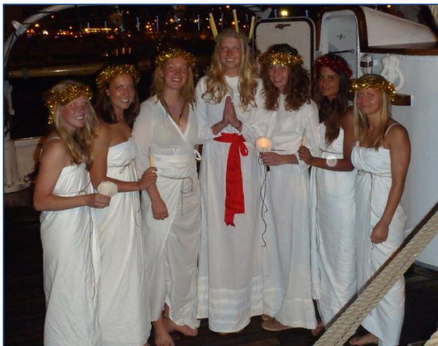
Gladans sjungande lusiabesättning

På lucia-dagen fortsatte vi seglingen, först till Morro Jable på södra Fuerteventura (22 nm) där vi stannade en natt och den 14 december på eftermiddagen kunde vi knyta fast i hamnen i Las Palmas på Gran Canaria efter en fin segling (60 nm). På kvällen bjöds vi på lussefirande vid marinens segelskuta Gladan. Sju tjejer ur besättningen sjöng fantastiskt fina lussesånger! Jag frågade kaptenen om de testade sångrösten innan de tog ombord besättning, men han förnekade detta!