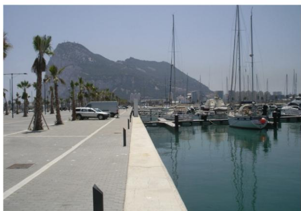
Gibaltarklippan från marinan i La Linea

Vi kom till Gibraltar den 30 juli och försökte få plats i någon av Gibaltars marinor, men det var fullt överallt. Vi gick då till den nya marinan i den spanska gränsstaden La Linea . Här låg vi bra, hade samma låga avgift som inne i Gibraltar och vi hade utmärkt utsikt över Gibaltarklippan. Med cykel tog det inte många minuter att komma in i Gibraltar, vi visade upp våra pass och blev viftade förbi tullen, vi behövde inte ens stanna cykeln! Det tog betydligt längre tid att åka bil, varje dag blev det kilometerlånga köer med bilar som ville köra in i Gibraltar.