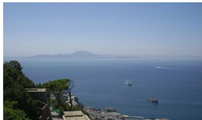
Det är inte långt mellan Gibraltar (i förgrunden) och Ceuta

Efter några dagar var alla seglare överens, nu är det dags att dra! Den 12 augusti bar det av, vi hade ingen vind och motström till att börja med så vi gick det första dygnet för motor. Sen kom vinden och motströmmen släppte. Vi hade lite orolig sjö i