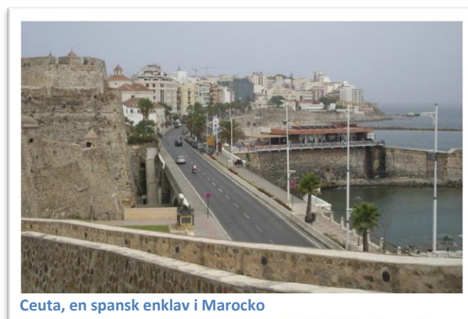
Ceuta, en spansk enklav i Marocko