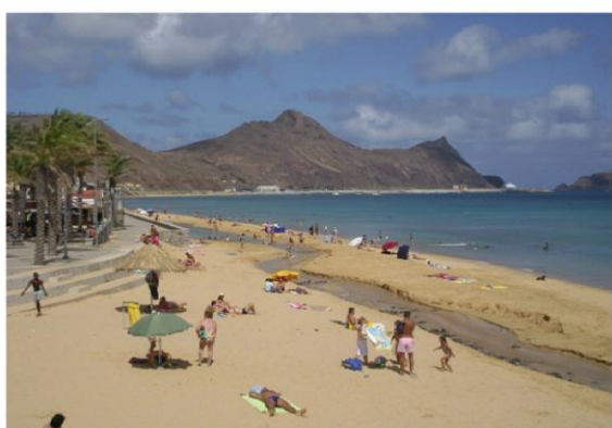
Porto Santo har en 9 km lång, fin sandstrand

Efter en vecka på Porto Santo seglade vi de 30 sjömil till Madeira och la oss i en ny marina på sydostsidan av ön, Quinta do Lorde. Här håller man på och bygger en semesterby som kommer bestå av ett 100 tal lägenheter, hus, kyrka, matbutik och torg. Blir nog fint när det blir klart, nu var det endast marinan och en restaurang som var i drift. På Madeira går det att fylla de svenska gasolflaskorna, ett företag kommer och hämtar flaskorna och levererar dem med ny gas. Vi hyrde bil och körde runt hela ön