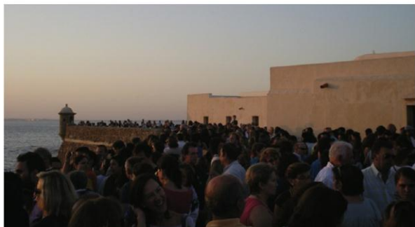
Solnedgångskonsert i Cadiz

Det var för varmt uppe i floden Guadiana , det var ingen vind och när temperaturen översteg 45 grader styrde vi ner till kusten igen. Temperaturen minskade 10 grader när vi kom ner till den spanska kuststaden Ayamonte , mer uthärdligt! Efter några dagar, där vi tvättade, bunkrade och sände vår inverter till Amsterdam för reparation, så seglade vi söder ut längs den spanska kusten. Chipiona blev nästa hamn. Chipiona är en semesterby med låga hus och små fina torg. Här finns också en lång fin strand med uppdämda basänger. Marinan delar hamn med fiskebåtarna så här är mycket måsfåglar. Vi hade