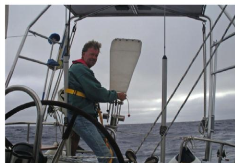
Vindrodet behöver justeras ibland

Marinan på Porto Santo ligger några km från staden men med cyklar så tog det inte många minuter. Vi strosade i byn, handlade mat, tittade på sevärdheterna, tog en busstur runt ön och badade vid den fantastiska 9 km långa stranden. Vattnet var varmt och fantastiskt