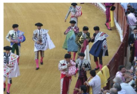
Tjurfäktning i Puerto de Santa Maria

Vi åkte till Sevilla och hälsade på gamla seglingskamrater på Olivia . Vi bodde på hotell i några nätter inne i de gamla delarna av staden, mer centralt går inte att bo. Sevilla är en trevlig stad som lämpar sig bra för turistande till fots, allt ligger inom bekvämt gångavstånd. Vi hade tur, det var inte så varmt i Sevilla under de dagar vi var där, inte mer än kring 35 grader och mulet... Sevilla är annars känt för att vara extremt varmt på sommaren. På hemvägen stannade vi i staden El Puerto de Santa Maria och såg på tjurfäktning. Det var en mycket speciell upplevelse då tjurfäktning så tydligt är en del av den sydspanska kulturen. Men det blir nog inga fler tjurfäktningar för vår del.