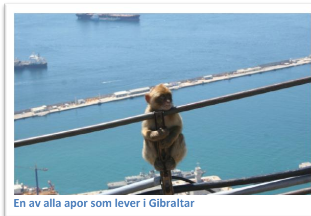
En av alla apor som lever i Gibraltar

I Gibraltar finns det apor. De importerades dit för flera hundra år sedan och det är enda stället i Europa som apor lever i frihet. Det sägs att Gibraltar skall förbli brittiskt så länge aporna finns kvar.