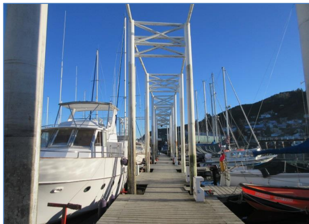
Det är 7 meter tidvattenskillnad vid Club Nautico de Reloncavi