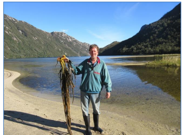
På stranden fanns den grova kelp vi inte vill ha i propellern