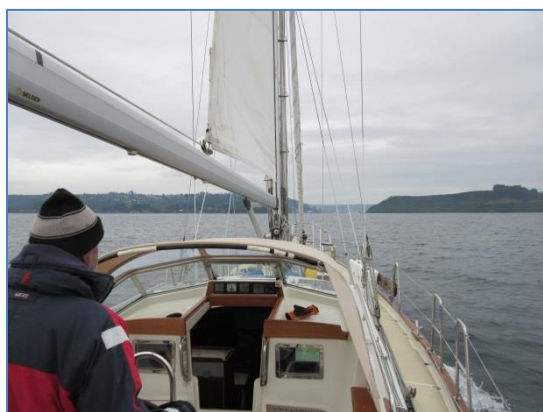
Nu ser vi Puerto Montt borta i gattet!