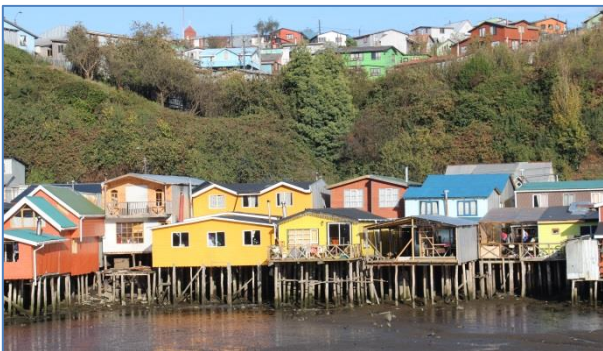
Några av de populära husen ”palafitos” i Castro

prövade också på den lokala rätten ”curanto” som består av musslor, räkor, fisk, kött, kyckling och potatis. En lite märklig anrättning som enligt gammal tradition skall tillagas i jorden på samma sätt som man tillagar mat i Polynesien.