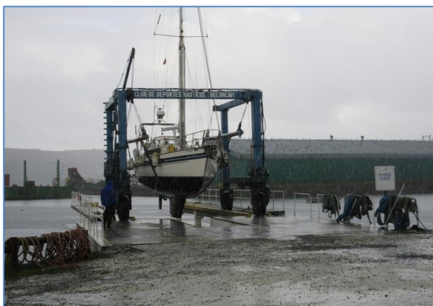
Randivåg lyftes för att vara på land under tiden vi var i Sverige