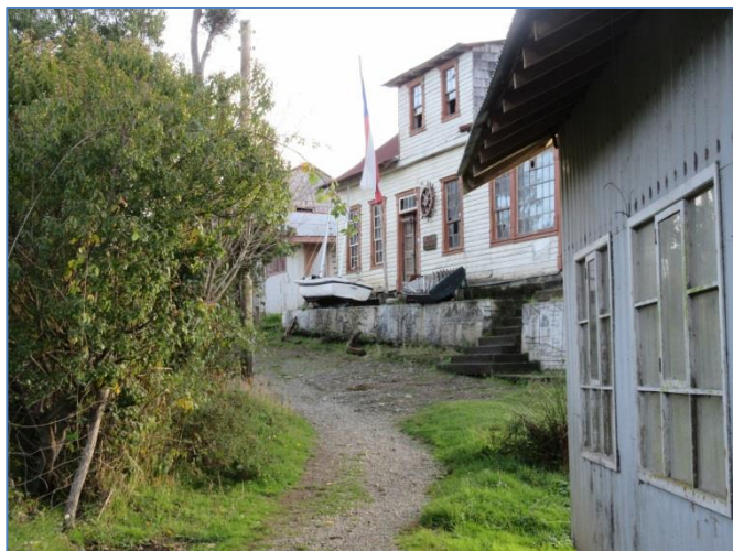
Den lilla byn på ön Mechueque

Den 11 maj lämnade vi den trevliga marinan och styrde norr ut. Två övernattningar och vi skulle vara i Puerto Montt – trodde vi. Första natten stannade vi i Mechueque, en ö strax utanför Chiloé, som har en