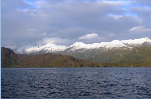
Det var snö på bergstopparna när vi kom ut i farleden

Den 3 april var vi uppe innan solen gått upp och tog in alla linor vi haft ute i Caleta Point Lay. Vi hade fyra linor i land och ett ankare för att hålla båten på plats i de hårda vindarna. Halv nio kom solen upp och vi kunde se att det hade kommit nysnö på topparna runt i kring oss. Det hade varit kallt på natten.