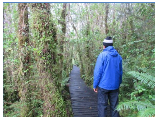
Den lummiga hotell-ön Jechica

Dagen därpå gick vi upp på stan, besökte hamnkontoret, tog ut