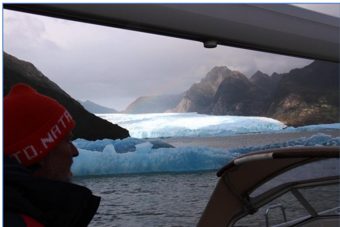
Vi kom till Chiles största glaciär som går ner i vattnet – San Rafael

trygga hamn och styrde ner mot glaciären i klart väder. På långt håll såg vi isberg flyta, stora, blå och häftiga! Laguna San Rafael är en rund, ca 3 sjömil stor lagun med den stora glaciären San Rafael längst bort. Glaciären är mer än 4 km bred och över 70 meter hög. Vi höll oss i utkanten av isfältet som bredde ut sig i viken medan vi närmade oss glaciären. En del av isen som flöt i viken var stor som isberg, alla var blå, men en del av dem hade en otrolig djupblå färg. Kärnis. När vi kom närmare isväggen såg och hörde vi isen falla ner i vattnet, det blev vågor i viken och hela miljön kändes