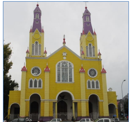
Den fina kyrkan i Castro

Eldslandet är delat mellan Chile och Argentina) och Sydamerikas femte ö med ca 9.000 km 2 (tre gånger så stor som Gottland) och här bor 140.000 personer. Ön har ett öppet, uppodlat landskap med hus överallt och landskapet påminner om Danmark, fast här är mer kuperat. Längs kusterna finns många fiskodlingar. Chiloé är mest känd för sina träkyrkor som europeiska jesuiter byggde på 1700- och 1800-talet, flera hundra kyrkor blev byggda och 16 av dem finns i dag med på Unescos världsarvslista. När kyrkorna byggdes tillhörde Chiloé Spanien och jesuiterna jobbade på att kristna befolkningen som bodde på ön. De många kyrkorna som byggdes längs kusten var ett led i detta arbete. Vi började med att besöka Castro, huvudstaden på Chiloé. Här finns hus som är byggda i vattnet på höga pålar, s.k. ”palafitos”. På 1950-talet som många öbor sökte sig in till Castro för att hitta arbete, potatisskörden hade slagit fel sju år i rad och livet på landet var hårt. Dessa fattiga jordbrukare hade inte pengar att köpa sig mark så de byggde hus ute i vattnet istället. I dag är husen eftertraktade och de renoveras till lyxiga bostäder. Vi fortsatte att åka runt ön med bilen och