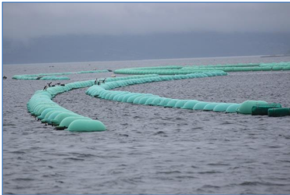
Vi ankrade innanför ostronodlingarna

pengar, handlade mat och diesel och besökte ett internetkafé. Efter några dagar i den livliga viken fortsatte vi norr ut. Det var tjock dimma som gjorde sikten obefintlig och det kändes bra att kunna ta radarn till hjälp. Mot eftermiddagen kom vi fram till Estero Pailad, en fin vik där vi ankrade utanför