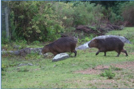
Capivarer som letar efter grönnare gräs

Det var ingen vind när vi lämnade Bahia da Ilha Grande bakom oss och styrde ut på Atlanten igen. Vattnet låg helt spegelblankt, det är ca 1 m dyning och vi går för motor. Vi ser inte många båtar, några fiskebåtar och två motorbåtar på väg mot samma håll. Många sulor som cirklade runt båten. Vid 16-tiden på eftermiddagen ankrade vi i viken vid Ilha Anchieta (eller Ilha Porcos). Vi tog ett dopp (fast det var lite kallt i vattnet), hällde upp var sin Caipirinha och grillade lite kött (Picanha) till middag. Det var en lugn och fin kväll, båten vaggade lite i dyningen som gick in i viken och vi somnade sött.