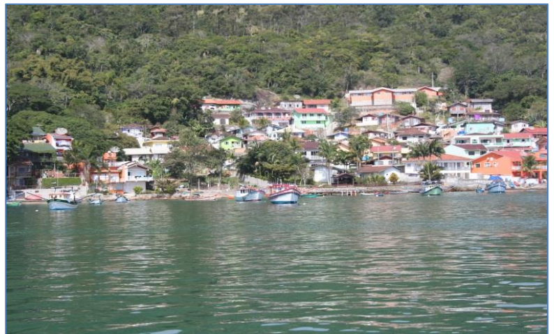
Porto Belo – en fin turiststad

internetmodem till datorn fungerade, vi kunde kolla väderprognosen och hålla oss à jour med världshändelserna liksom sända mail och uppdatera hemsidan. På mornarna försökte vi få kontakt med Runaway och Bold Venture på kort-vågsradion, båda skulle segla till Salvador. Vissa dagar kunde vi prata med varandra, vissa dagar hördes de inte. Den 19 augusti kunde vi lämna Paranagua och trots en prognos som talade om 5-8 m/s så var det ingen vind när vi kom ut på havet. Motorn fick jobba hela natten och då vi hade en jobbig dyning från sidan blev det en obehaglig rörelse i båten. Det var svårt att sova. Vi såg en hel del pingviner i vattnet, och en del sjöfågel. Vi kom fram till Porto Belo nästa dag och ankrade i en fin vik. Husen klättrade längs bergväggen och allt andades lugn och ro. Vi tankade diesel och vatten och träffade besättningarna på de tre tyska båtar som ligger här: Out of Rosenheim , Green Duck och en utan namn på skrovet. Här kom nästa lågtryck ilande och vi blev kvar i Porto Belo i 10 dagar innan vinden vände. Själva staden är säkert mysig och trevlig på sommaren, men mitt i vintern kändes den lite öde. Bra matbutik fanns dock och flera ställen där man kunde kolla vädret på internet (vårt modem till datorn fungerade inte här).