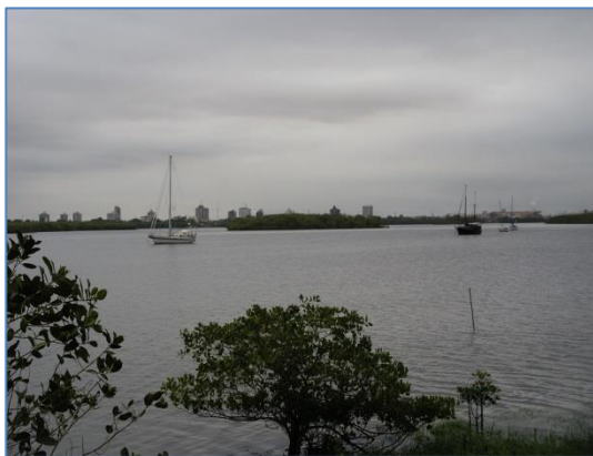
Randivåg för ankar utanför Paranagua

Den 7 augusti fortsatte vi mot Paranagua och efter en lugn och händelselös segling kom vi in till båtklubben i Paranagua dagen efter. Vi fick inte plats vid båtklubben men kunde ankra vid deras uthamn. Vi kunde åka med den "färja" som båtklubben hade från sin uthamn in till marinan, en service de inte tog