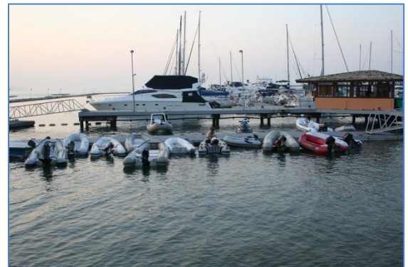
Den trevliga båtklubben vid Ilha Bela

Den 5 augusti fortsatte vi och då det fortfarande inte var någon vind gick vi för motor in till Santos, Sao Paulos hamnstad. Efter att ha passerat ett 100-tal fartyg för ankars som väntade på att få komma in i Santos hamn, tuffade vi in till Santos Iate Club. Vi fick en plats vid en betongbrygga glada över att slippa den 2,5 meter höga dyningar vi haft under dagen. Dagen därpå hade vi sjunkit ner i dyn och båten gick inte att rubba. Vi började höra oss för om en djupare plats och den tredje vi blev erbjudna skulle nog hålla oss flytande även i lågvatten nästa morgon när vi tänkte lämna hamnen.