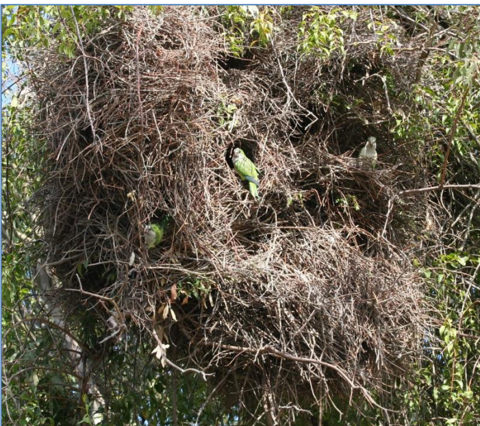
Munk-papegojorna vid sitt ”hyreshus”-liknande bo