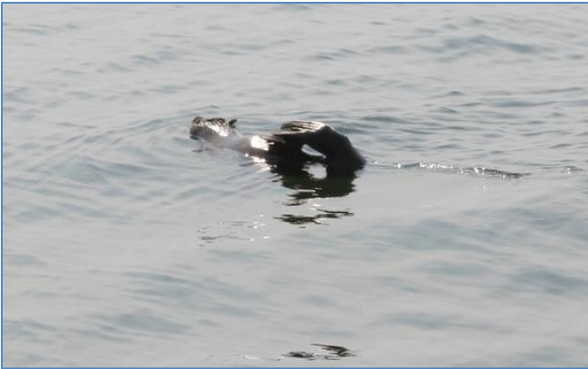
Ett sjölejon som ligger och solar sig ute på havet

stötta lite med motorn för att göra bra fart, ibland seglar vi i god fart enbart för vinden. När vi får en