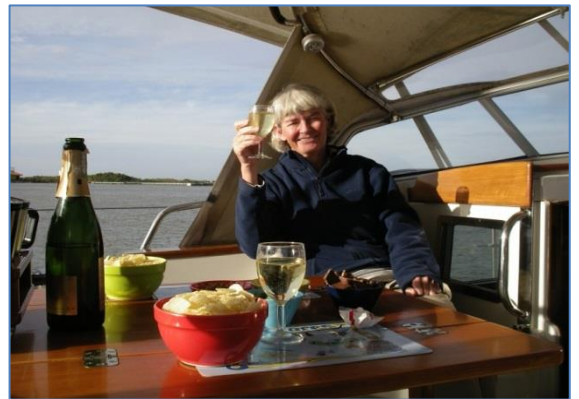
60-årsdagen firades i strålande sol – men det var rätt kallt!

Rio Grande do Sul (finns ett Rio Grande i norra Brasilien också) ligger vid den stora sjön Lagoa dos Patos där alla segelbåtar i klubben seglar. Sjön är drygt 100 sjömil lång och här finns många öar och vikar att ankra vid. Segelbåtarna här seglar inte ute på havet. Staden är en livlig hamnstad utan direkt charm men ändå rätt trevlig. Vi undvek myndigheterna och grejade med båten, utforskade staden och omgivningarna med tyska Bernhard (som hade en Najad 390 i hamnen) och åt en riktig födelsedagsmiddag på en traditionell grill-restaurang. Det märktes att våren var